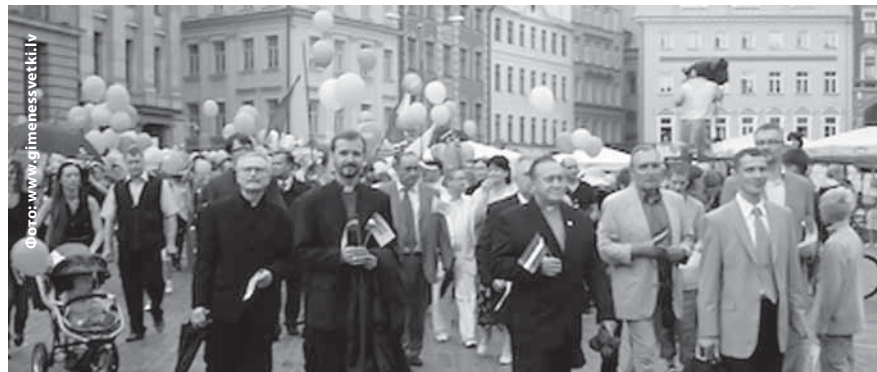
Руководители христианских конфессии возглавили парад семей в 2007 году

Праздник Семьи начнется в Риге 24 мая в 11.00 в Верманском парке, где дети вместе с родителями смогут принять участие в различных играх и аттракционах. Параллельно с этим, будут проходить различные